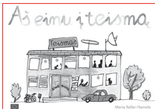
Litewskie i łotewskie tłumaczenie polskiej książeczki dla dzieci „Idę do sądu”.

cje pozwalają na podnoszenie standardów rozwiązań funkcjonujących w poszczególnych krajach.