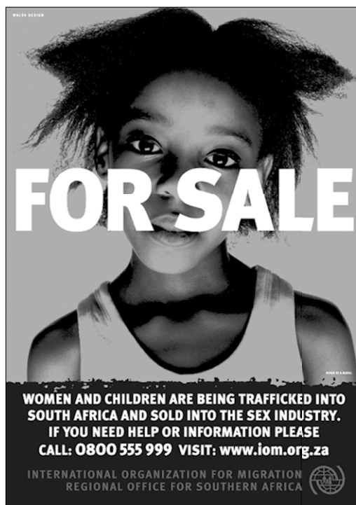
Plakat kampanii SACTAP; więcej na stronie: www.iom.org.za/CounterTrafficking.html#SACTAP

ma na celu wspieranie instytucji rządowych i pozarządowych w walce z problemem handlu ludźmi, jak również rozwijać system pomocy dla ofiar i promować wiedzę nt. problemu. SACTAP ma cztery kluczowe komponenty: pomoc ofiarom handlu, rozwój wiedzy nt. problemu, badania i zbieranie danych nt. handlu ludźmi w regionie oraz informowanie i wzrost świadomości społecznej nt. problemu. W ramach działań SACTAP udało się m.in. ustanowić bezpłatną linię pomocową dla ofiar i osób zagrożonych handlem w RPA, Zambii i Zimbabwe, przeszkolić ponad 3 000 pracowników instytucji rządowych i pozarządowych w rejonie, jak również opublikować wydawnictwa nt. problemu handlu ludźmi. SACTAP zorganizował także jedną z najbardziej widocznych kampanii nt. handlu ludźmi, której przekazy — w językach narodowych (ponad 20) — są dostępne w każdym z krajów regionu.