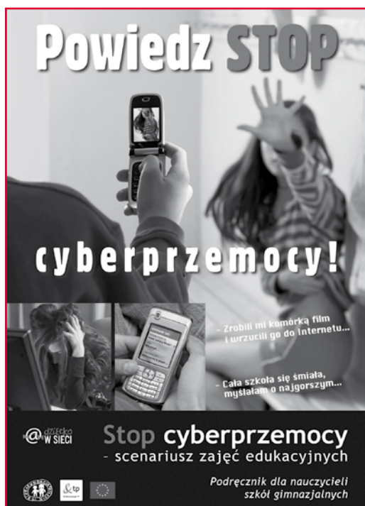
Plakat z kampanii „STOP cyberprzemocy”

W Polsce pionierem działań edukacyjnych w temacie cyberprzemocy była Fundacja Dzieci Niczyje, która od stycznia 2008 r. wraz z Fundacją Grupy TP prowadzi ogólnopolską kampanię społeczną STOP cyberprzemocy . Potrzeba pilnych działań w obszarze cyberprzemocy wynikała nie tylko z badań 10 pokazujących wysoką skalę problemu w kraju, ale również z praktyki zespołu Helpline.org.pl, który świadczy pomoc w sytuacjach zagrożeń dla najmłodszych w Internecie. Aż 757 spośród 1644 obsłużonych przez zespół Helpline.org.pl w 2008 r. zgłoszeń dotyczyła przypadków cyberprzemocy.